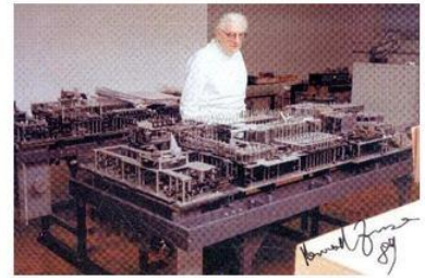
Prof. Konrad Zuse mit Nachbau der Z3